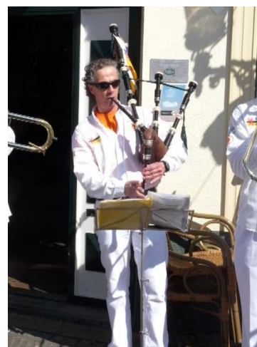
John v. Buggenum

Kòmpleminte oet Mestreech. Vaan 's-Mörgesvreug tot aon ut Stareleech... Beleve veer meziek in eus hart... En wachte mèt smart... Op ut ind vaan deez pandemie Daan kinne veer, nondepie... D'r weer veur goon... En zal Limburg Orange nog hiel get jaore d'r veur uszelf èn gans Limburg stoon.