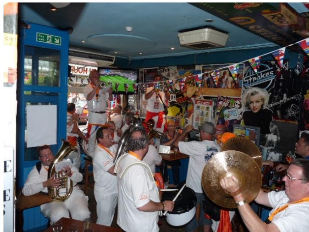
Vlak bij Covent Garden. "Hey Jude" in bar Belushi. Londen in tranen, kippevelmomenten