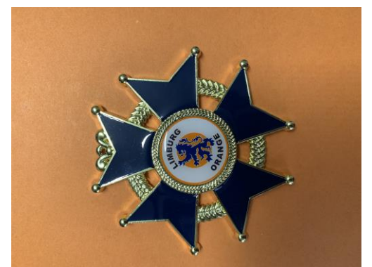
Orange Medal of Honor