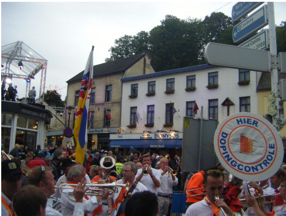
WK wielrennen Valkenburg. Hier dopingcontrole: zie sousafoon

Dames en heren, nog ff geduld. En dan mogen we weer, ervaringen opdoen, genieten van al dat lekkers, mooie muziek laten horen, maar vooral zorgen voor GEZELLIGHEID.