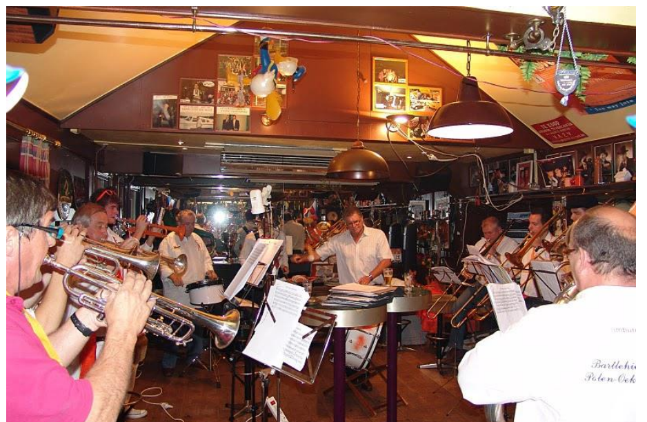
Tweede repetitie dinsdag 13 september 2011