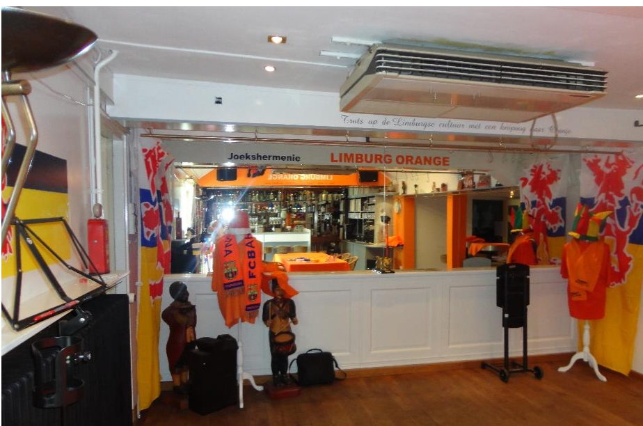
Oranje pub in aanbouw 2010