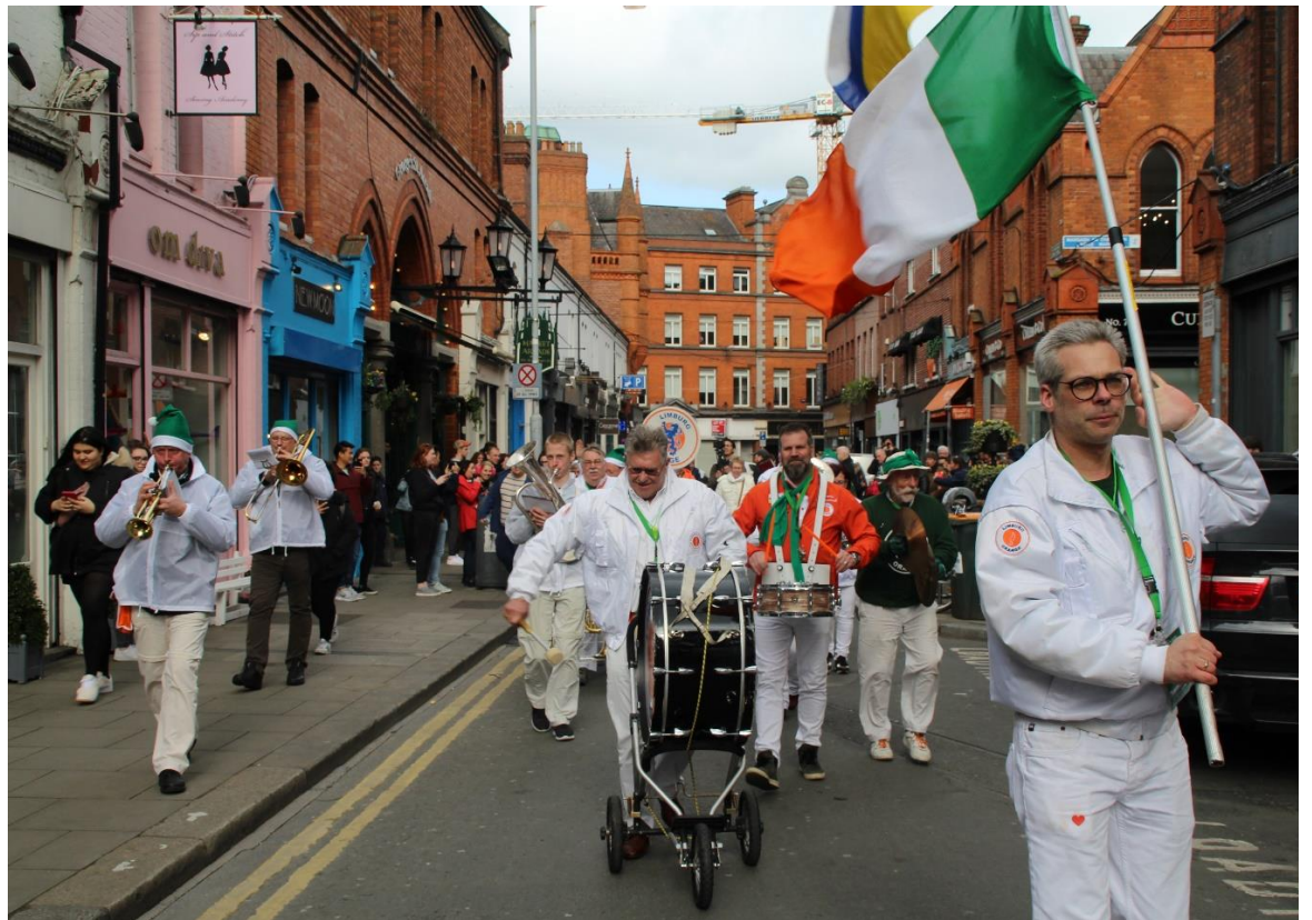
Ierland 2019 St. Patrick's Day, Dublin was aangenaam verrast

Oefenen, oefenen, oefenen en.....Guinness, Guinness, Guinness en.....Carlsberg, Carlsberg, Carlsberg en.....nog veel meer