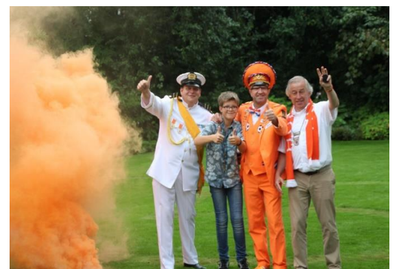
Dé Oranje generaal Winfried Litjens uit echt † 24 juli 2016 (58 jaar)